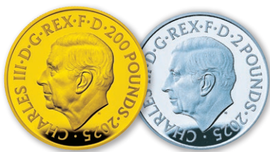
金貨 / 銀貨 表面デザイン (左: 金貨、 右: カラー銀貨)