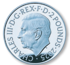
金貨 / 銀貨表面デザイン (左：金貨、右：カラー銀貨)