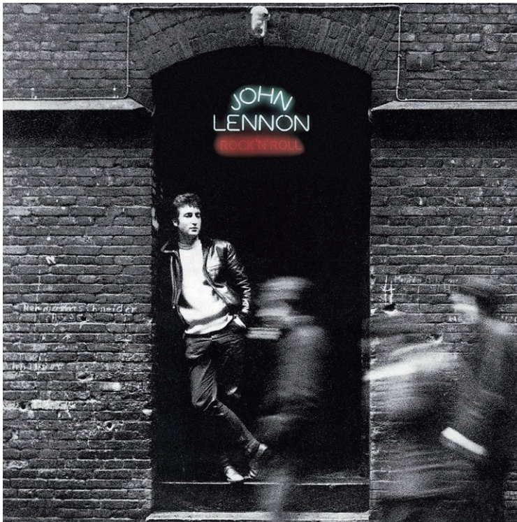
© 2025 Yoko Ono Lennon.Lennon and John Lennon are trademarks of Yoko Ono Lennon.

2025 年で生誕 85 年を迎えるジョン・レノン。 現在も世界中で絶大な人気を誇るアーティストです。 バンド時代、ソロ時代ともにその一挙手一投足が注目を集め、 生み出してきた名曲は数知れず。 愛と平和の象徴として、彼の想いは今も人々の心に 刻まれています。 誕生日の10月9日にちなんで数字の「9」を大切にしていた ジョン。作品の中にも「9」が入った曲が多数存在しています。