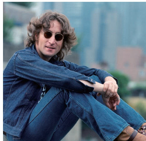
© 2025 Yoko Ono Lennon. Lennon and John Lennon are trademarks of Yoko Ono Lennon.

コイン中央には、「ジョン・レノン」の横顔を印象的なタッチで描写。コインの左側には、英語で「JOHN LENNON」の文字を刻印。「LENNON」の文字にジョンの髪の毛や肌が映りこんだデザインが特徴的です。さらにコインの右側には、ジョンの代表曲である「IMAGINE」のタイトルが英語で刻まれています。