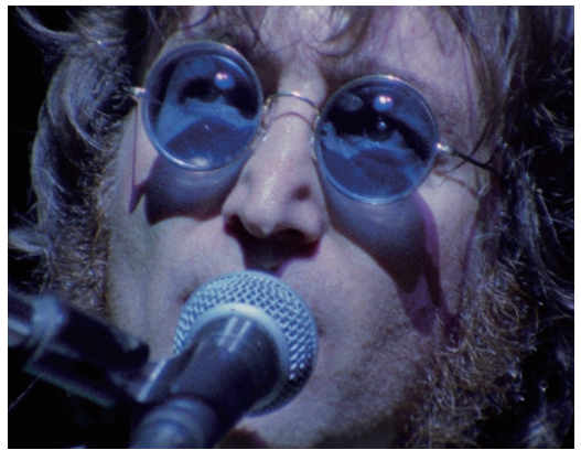
© 2025 Yoko Ono Lennon.Lennon and John Lennon are trademarks of Yoko Ono Lennon.