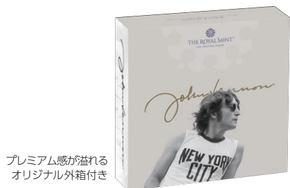
プレミアム感が溢れる オリジナル外箱付き