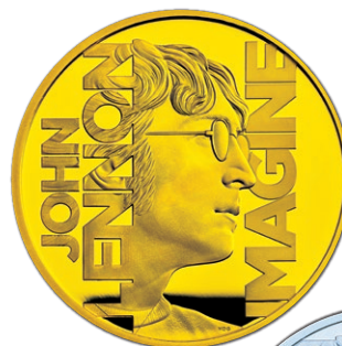
金貨 / 銀貨 裏面デザイン (上段: 金貨 下段: カラー銀貨)

コイン表面の中央には英国国王「チャールズ3世」の肖像。そのまわりには額面に加え、ラテン語で「神の恩寵による王、信仰の守護者」を意味する「D.G.REX.F.D(Dei Gratia Rex Fidei Defensorの略)」の文字が刻まれています。また「チャールズ3世」の首元には、肖像をデザインした英国人彫刻家マーティン・ジェニングス氏のイニシャル「MJ」も刻印されています。オリジナル外箱も付属しています。