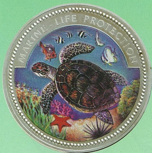
442 KM 33