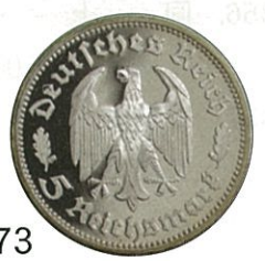
5 ライヒスマルク銀貨