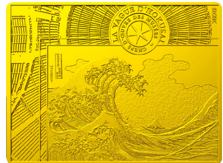
葛飾北斎生誕260年記念「北斎金貨」 (富嶽三十六景 神奈川沖浪裏)