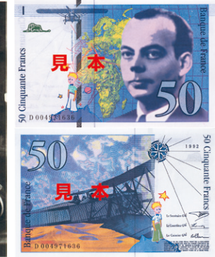
「星の王子さま」と肖像が描かれた50フラン紙幣