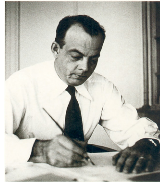
サン=テグジュペリ

「星の王子さま」は、300以上の言語に翻訳され全世界での累計発行部数は2億部以上にのぼり、大人から子供まで世代・国・時代を超えたロングベストセラー童話となりました。日本では1953年に岩波書店より初版を発売以来800万部以上発売。1999年には世界初の「星の王子さまミュージアム」が神奈川県箱根に誕生するなど、根強い人気を誇っています。砂漠に飛行機で不時着した「僕」が出会った小さな王子さまの物語が問いかける、素朴かつ深いメッセージと言葉の数々は、三四半世紀の時を超えてなお、現代に生きる人々の心をとらえてやみません。