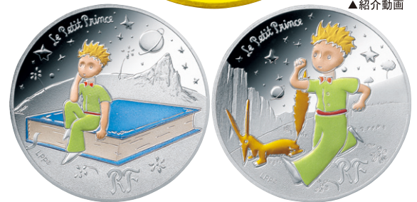
上段/500ユーロ金貨 ぼくと三日月(原寸大)

<500ユーロ金貨 ぼくと三日月>は、星の王子さまの記念コインとしては最大となる、重さ155.5g(500円硬貨の約22倍)、直径50mm(同約2.4倍)の5オンスサイズ。発刊75周年にちなみ世界で限定75枚発行される希少価値の高いもので、このうち70枚が日本で販売されます。また、200ユーロ金貨、50ユーロ金貨3種を含めいづれも純度99.9%の高品位となります。