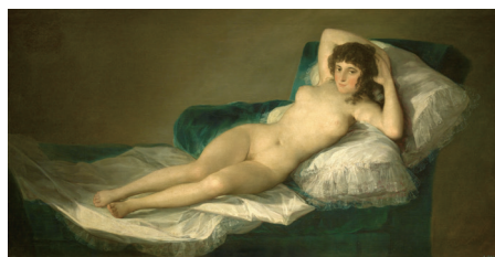
フランシスコ・デ・ゴヤ作「裸のマハ」 (1800年以前 キャンバス・油彩)

プラド美術館で最も所蔵作品数の多い<フランシスコ・デ・ゴヤ>が描いた唯一の裸婦像で、19世紀初頭にスペイン首相を務めたマヌエル・デ・ゴドイに納められたとされる名画がモチーフ。裸婦像を中心に配置し、緻密な色彩で作品をリアルに表現しています。コイン上部には作者名が刻印され、正方形の周りには額縁を連想させる華やかな模様が施されています。