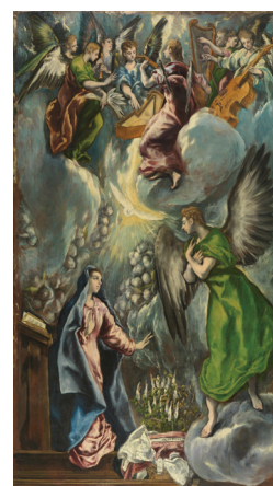
エル・グレコ作「受胎告知」 (1597-1600年 キャンバス・油彩)

<エル・グレコ>の大作の一つで、マドリードのドーニャ・マリア・デ・アラゴン学院の大祭壇画の一部として制作された迫力ある作品がモチーフ。縦長の構図から人物と光の部分を中心に配置。緻密な色彩が作品の神々しさをリアルに表現しています。コイン上部には作者名が刻印され、正方形の周りには額縁を連想させる華やかな模様が施されています。