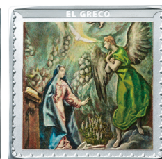
上/王太子カルロス銀貨 左/裸のマハ銀貨 右/受胎告知銀貨