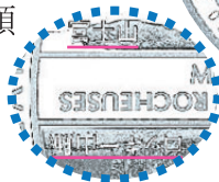
←日本語で刻印されている部分

富士山 ●噴火を繰り返し形成された荘厳な姿で古くから信仰の対象になっています。多くの文学や絵画の題材となり、浮世絵などを通じて西洋芸術にもジャポニズムという大きな影響を与えました。日本最高峰としてその気高い美しさは今なお人々を魅了し続けています。