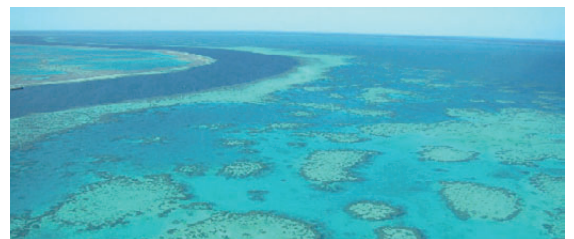
トレス海峡からブリスベン付近まで約2,000kmに広がる珊瑚礁