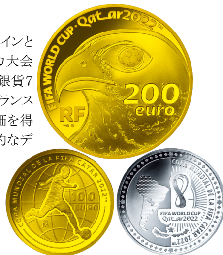
上段: フランス200ユーロ金貨

税込価格は、<フランス200ユーロ金貨>が638,000円、<フランス50ユーロ金貨>が165,000円、<スペイン100ユーロ金貨><パラグアイ1500グアラニー金貨>が各154,000円、<金貨3種セット>が473,000円、<銀貨3種セット>が46,200円。